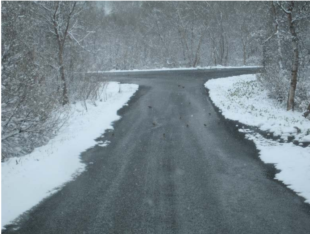
Vor í Vaglaskógi