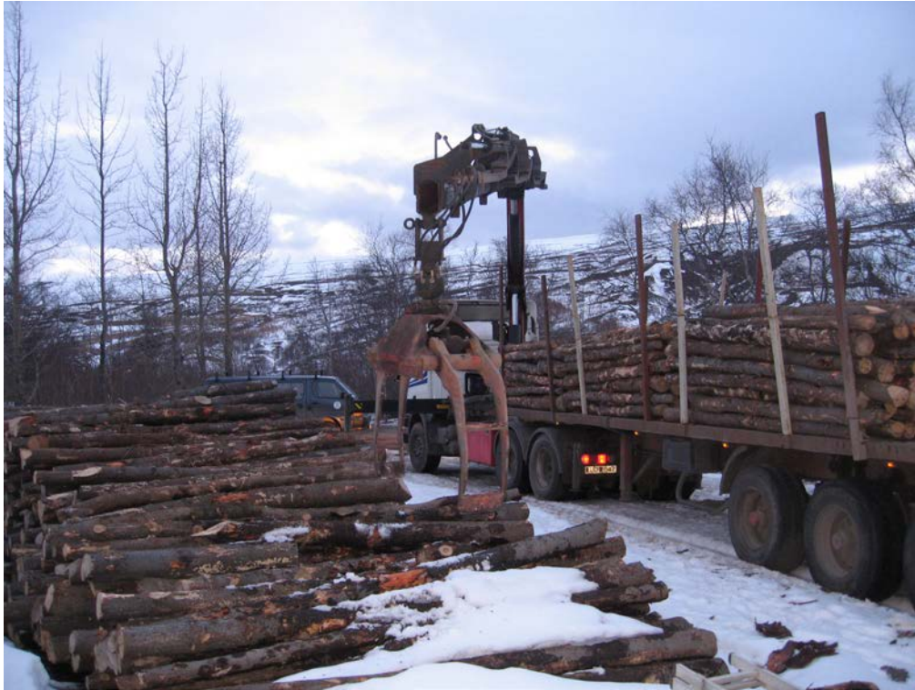
Viðarflutningar úr Vaglaskógi