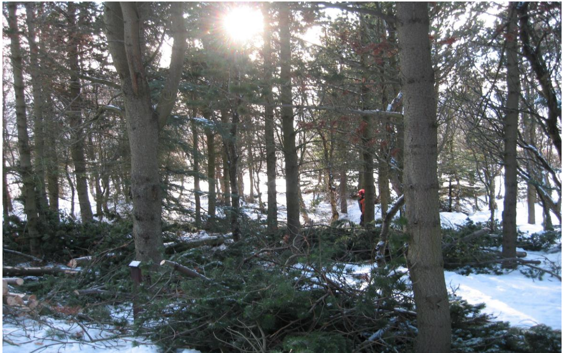
Grisjun í Reykjarhól