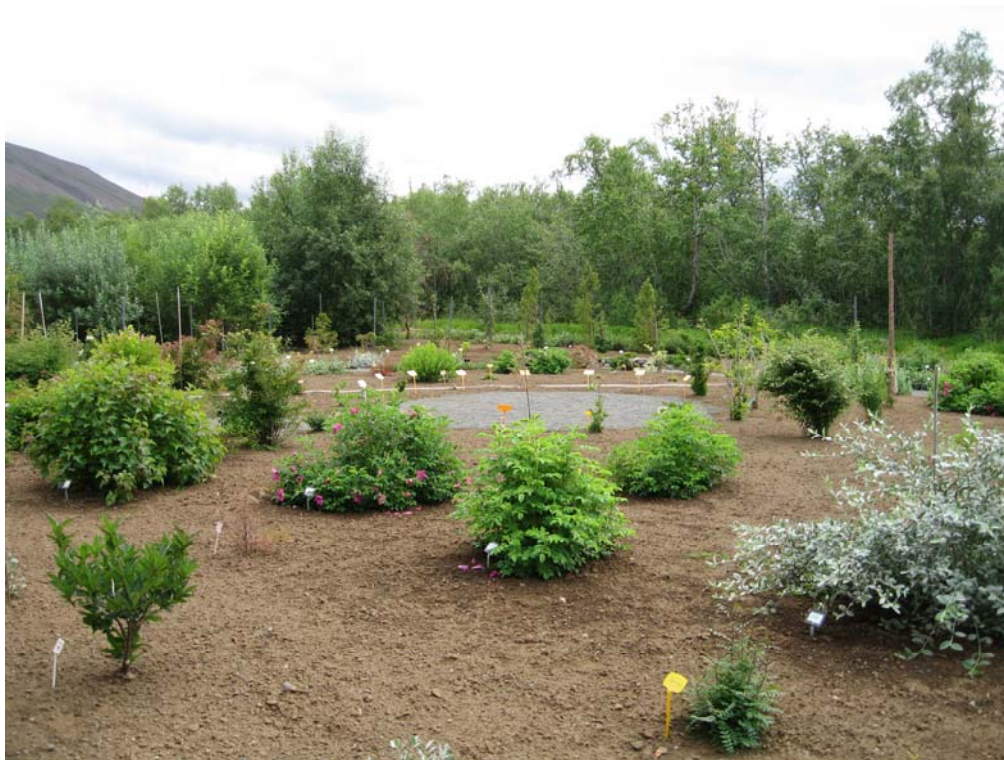
Runnasafn á Vöglum

Pottaplöntur voru seldar fyrir kr. 7,110. 113 sumargræðlingum var stungið til eigin nota. Pottaðar voru 445 plöntur, þar af 93 v/fræræktar, aðrar til eigin nota. Seldar og afh. voru 69 pottaplöntur.