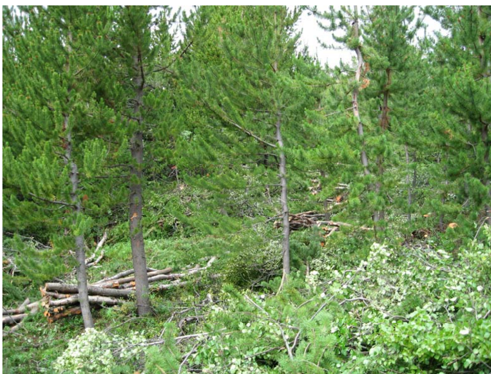
Skógarhögg í Þórðarstaðaskógi