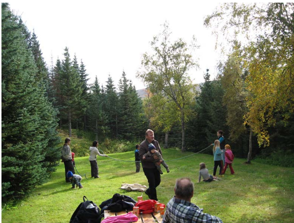
Fjölskyldudagur í Vaglaskógi

Fjölskyldudagur fyrir starfsfólk Skógræktar ríkisins var haldinn í Vaglaskógi 8. September. Farið var í gönguferðir og leiki og haldin grillveisla í lok dags. Alls mættu 32.