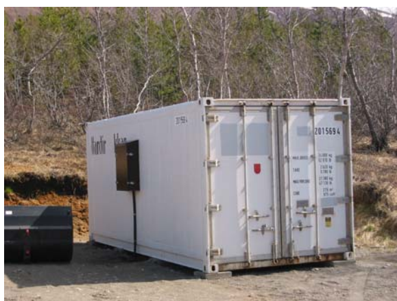
Þurrkgámur fyrir við

Komið var upp þurrkgám á Vöglum og hefur hann breytt miklu um gæði arinviðar.