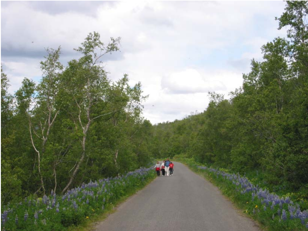
Ferðafólk í Vaglaskógi