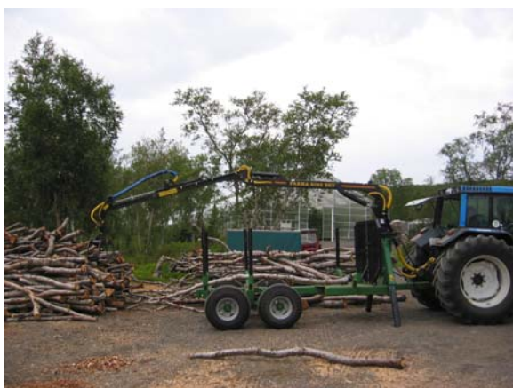
Nýr viðarvagn í notkun

Viðhald véla var með meira móti þetta ár, þá aðallega á dráttarvélum. Keyptur var nýr viðarvagn með krana og nýr sturtuvagn. Viðarvagninn breytti miklu um flutning á viði úr skógi. Keypt var ein ný keðjusög og ein toppgreinasög (keðjusög). Eins og fram kemur í kaflanum um viðarsölu, var keyptur þurrkbúnaður sem komið var fyrir í einangraðum gám, og hefur hann breytt miklu um gæði arinviðar, sem sendur er á markað. Byrjað er að gera tilraunir með þurrkun á birkikurli, sem notað er í reykofna. Búið er að panta sagarbekk, sem bæði er með keðjusög og bandsög, til að fletta við.