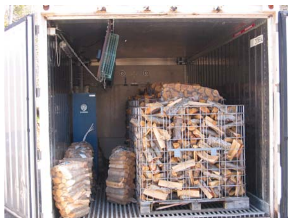
Arinviður í þurrkun