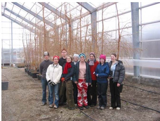
10. bekkur Stórutjarnarskóla í fræhúsinu á Vöglum

10. bekkur Stórutjarnarskóla kom í heimsókn 20. mars og kynnti sér starfssemina.