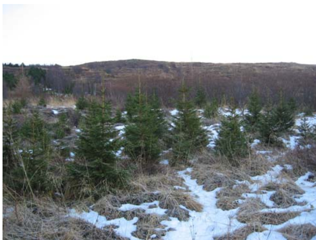
Rauðgreni jólatré Vöglum á Þelamörk