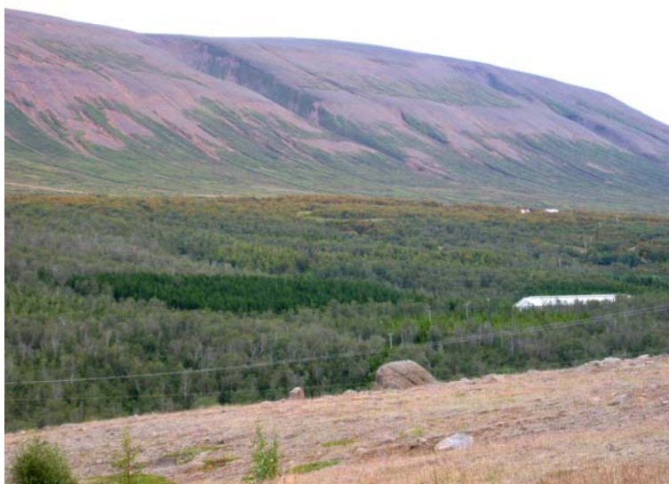
Skaðar á birki í Vaglaskógi

Skaðar vegna frosts í maí kom fram á fjallapin, greni, ösp og lerki. Ekki hefur þetta þó drepið nema einstaka tré.