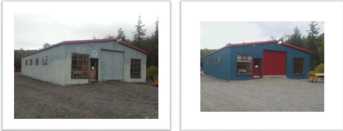
Skemman fyrir og eftir máluð.

Skemman var máluð um sumarið og varð á henni mikil breyting eins og sést á myndum hér fyrir neðan. Um það verk sá Sigurður Jóhann Freygarðsson á Hálsi.