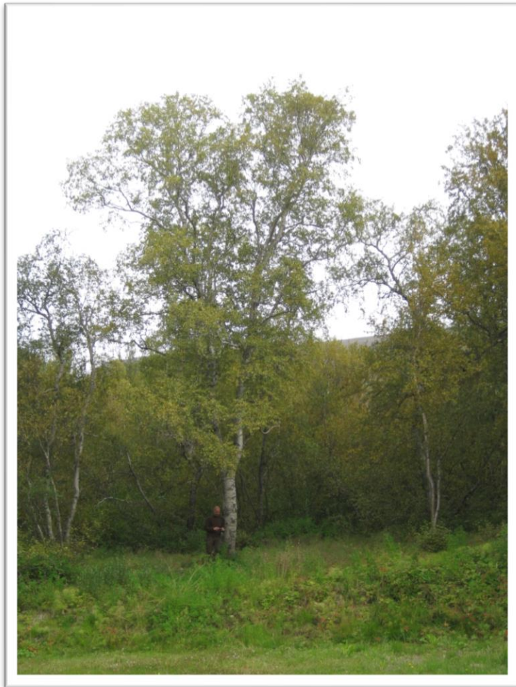
Hávaxnasta birkitré landsins í Vaglaskógi.