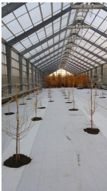
Í fræhúsinu.

Þegar dúkurinn var kominn á gólfið var borað fyrir ágræddum lerkifrætrjám sem í kjölfarið voru sett niður í húsið. Vantar nú lítið upp á að búið sé að fylla allt Fræhúsið af evrópu- og rússalerki til fræfaleiðslu og er það stór áfangi.