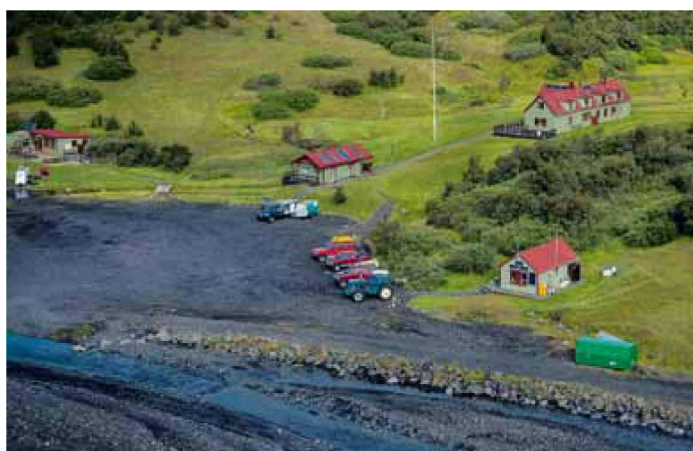
Þórsmörk Séð yfir skála Ferðafélags Íslands í Langadal en í Slyppugili eru Farfluglar með sína aðstöðu. Útivist hefur verið með aðstöðu í Básun.

Ferðafélagsins og austur fyrir aðstöðu félagsins Farflugla í Slyppugili. Afmarkaðar eru tvær þjónustulóðir fyrir gistiskála og þjónustuhús fyrir ferðamenn, ásamt reit fyrir tjaldsvæði. Jafnframt er afmörkuð lóð fyrir núverandi aðstöðu Skógræktar ríkisins og gert er ráð fyrir byggingarreitum á hverri lóð.