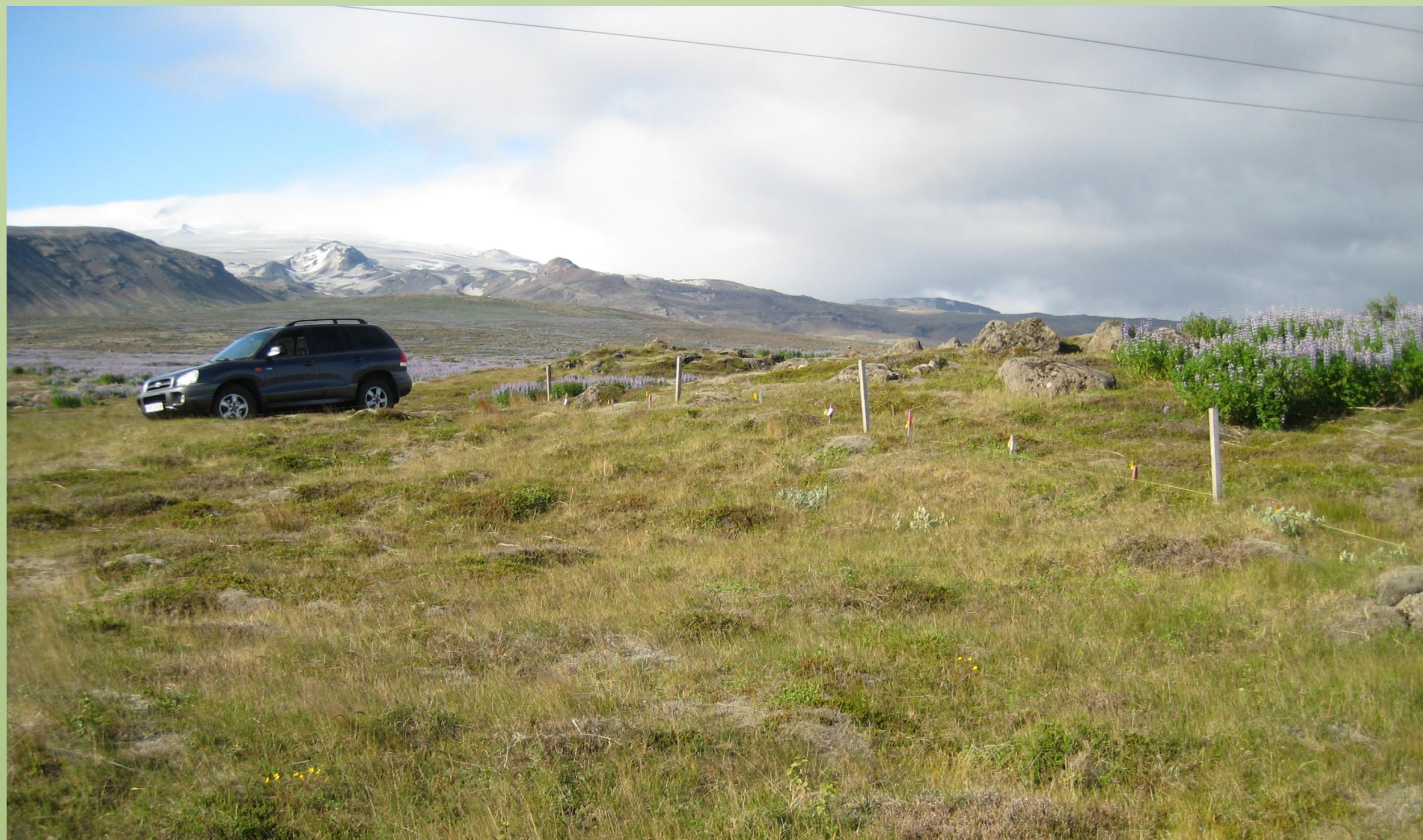
1. mynd. Tilraunin á Hofsnesi í Örfum. Ljós. BDS 2009.

1 Skógræktarfélag Garðabæjar; 2 Landbúnaðarháskóla Íslands